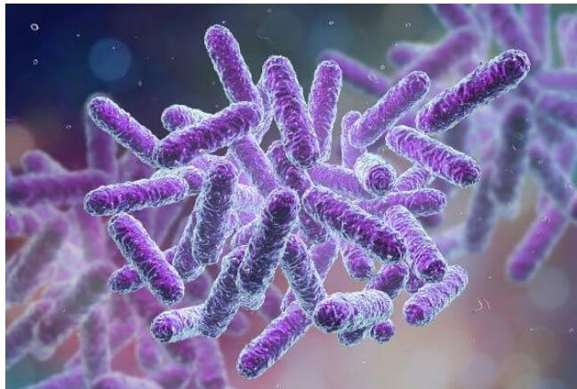
O sintoma de uma bacteriose depende da bactéria causadora.

Os sintomas das doenças bacterianas são variados e dependem da bactéria causadora da doença. A seguir vamos mostrar alguns sintomas comuns em doenças bacterianas e também com qual doença o sintoma está relacionado.